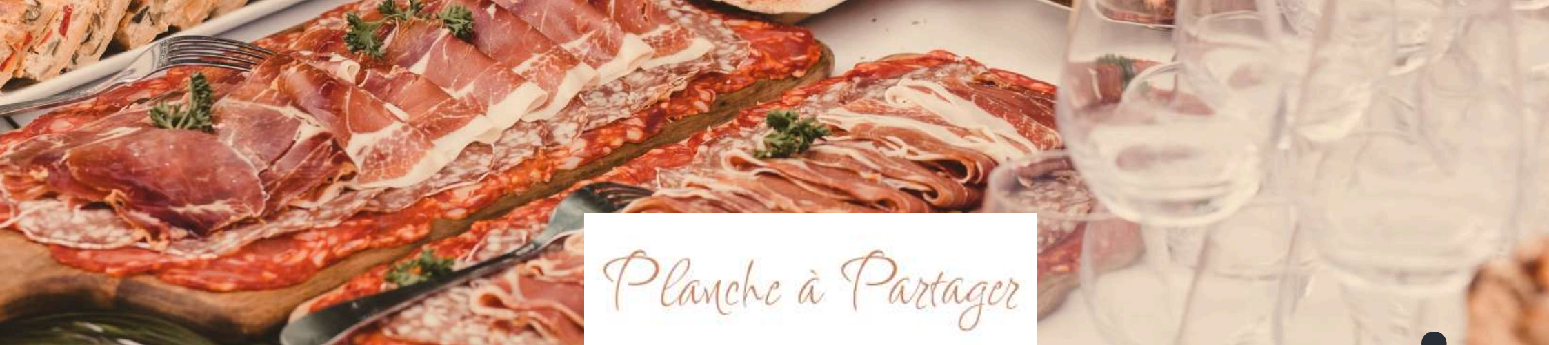
Planche à Partager